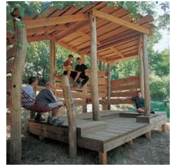
Stoere blokhut voor de jeugd