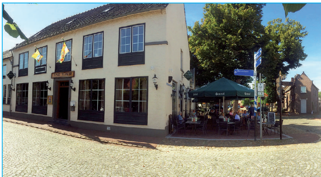
't Aod Klooster augustus 2019 - Grand Café met gezellig terras.