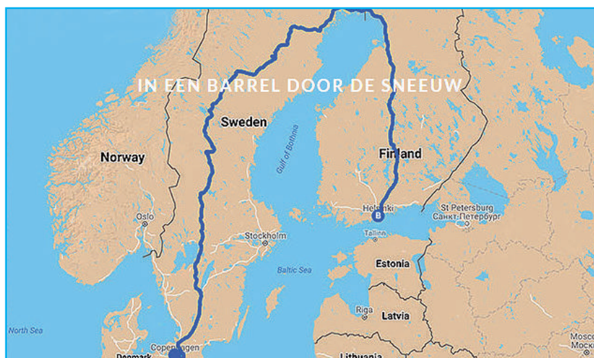
De Carbage run wintertocht 2019: van Kopenhagen naar Helsinki.

Wie durft het aan? Piet heeft het gedaan. Ondanks de strenge eisen moet ieder jaar geloot worden om mee te mogen doen, want de vraag is vele malen groter dan het aanbod, in totaal mogen slechts 400 wagens de tocht maken.