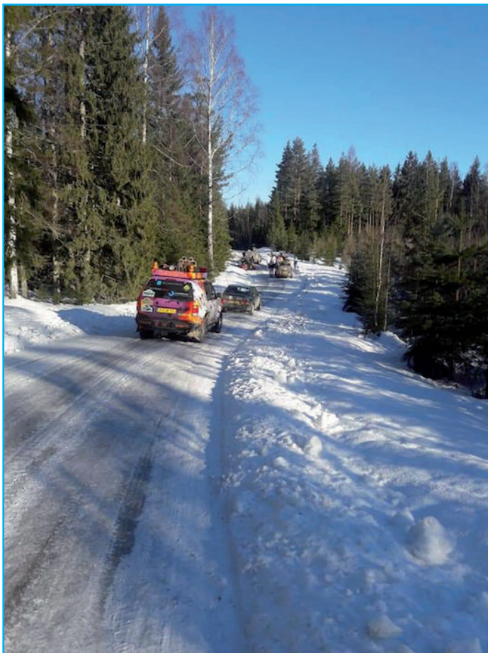
Bij de grens tussen Zweden en Finland.

De route is beschreven in een logboek en zal zo door iedereen gevolgd dienen te worden. Iedere deelnemer volgt dezelfde weg. Dit is gemakkelijk voor het geval je pech krijgt of vast komt te zitten in de sneeuw. De wegen zijn vaak alleen maar aangegeven door middel van paaltjes langs de kant van de weg, vooral als er verse sneeuw gevallen is. De onderlinge collegialiteit en behulpzaamheid is ontzettend groot, je krijgt van iedereen hulp, het wedstrijdelement zit puur en alleen in de verfraaiing van de wagen en het uitvoeren van de opdrachten.