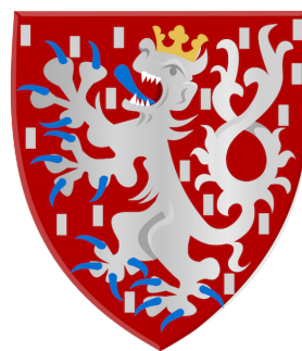
Stamwapen geslacht Pietersheim

Pietersheim (1320-1357), heer van Stevensweert.