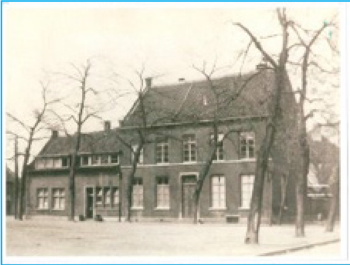
Het Oud Klooster anno 1925

hoofd van de meisjesschool en één zuster was bestemd voor de naaischool en nam ook de zorg voor de zieken op zich.