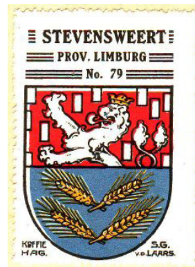
In de koffie Hag album ca. 1930

In het wapen (verleend op 26-11-1897) zien we op een rood vlak: elf zilveren blokjes, een dubbelstaartige leeuw van zilver met een gouden kroon. Op het blauwe vlak vier gouden korenaren in twee diagonale stroken. De geschiedenis van dit wapen is terug te voeren naar het geslacht van de heren van Pietersheim. Pietersheim was een heerlijkheid die bestaan heeft van de 11e eeuw tot 1794. De heerlijkheid werd genoemd naar het gehucht Pietersheim, met het