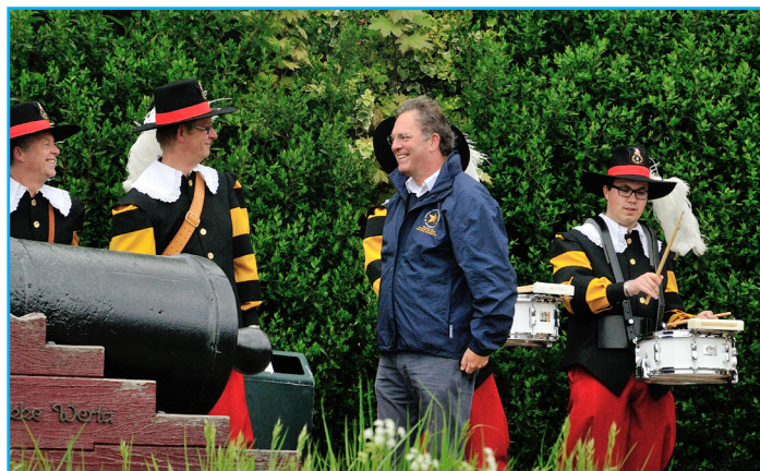
J-W (m.) bij de schutterscompagnie

weert en van alle activiteiten in ons dorp; denk hierbij o.a. aan de Harmonie, de schutterscompagnie (foto m.) , het kindervakantiewerk en kaarsenfeest. Een van mijn lievelingsfoto's is gemaakt in het Weerterbos waar koetsen met paarden in de herfst te zien zijn; de kleuren en de atmosfeer die die foto uitstraalt zorgen ervoor dat je het 'voelt' en kunt zien. Een tip voor het fotograferen: zorg ervoor dat je onderwerp er goed en vol in beeld opstaat, de achtergrond vult zich vanzelf wel in, probeer niet die hele berg in Oostenrijk en de mensen in beeld te krijgen want dan worden de mensen stipjes.