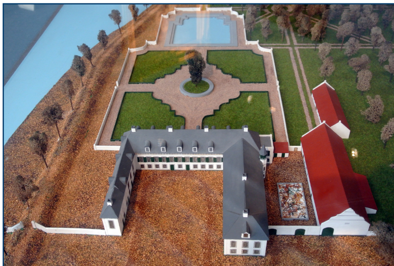
Tuinmuren goed zichtbaar op maquette.

Uiteraard gaan we de openstelling van Walburg op een later moment met elkaar vieren.